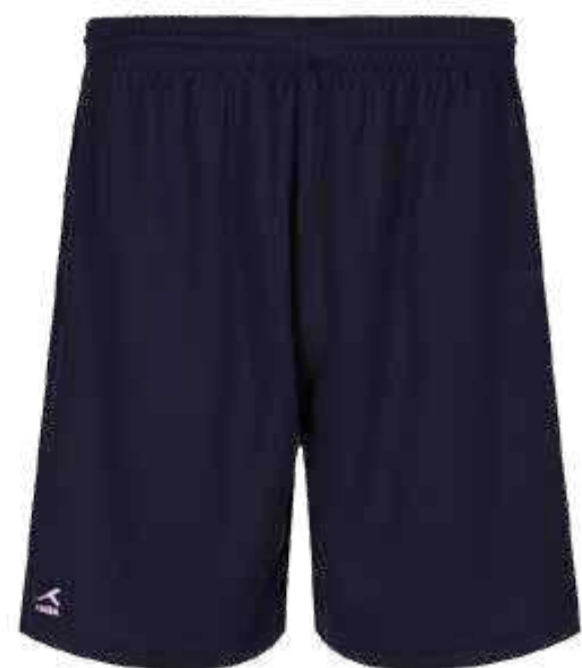
Granatowe szorty sportowe