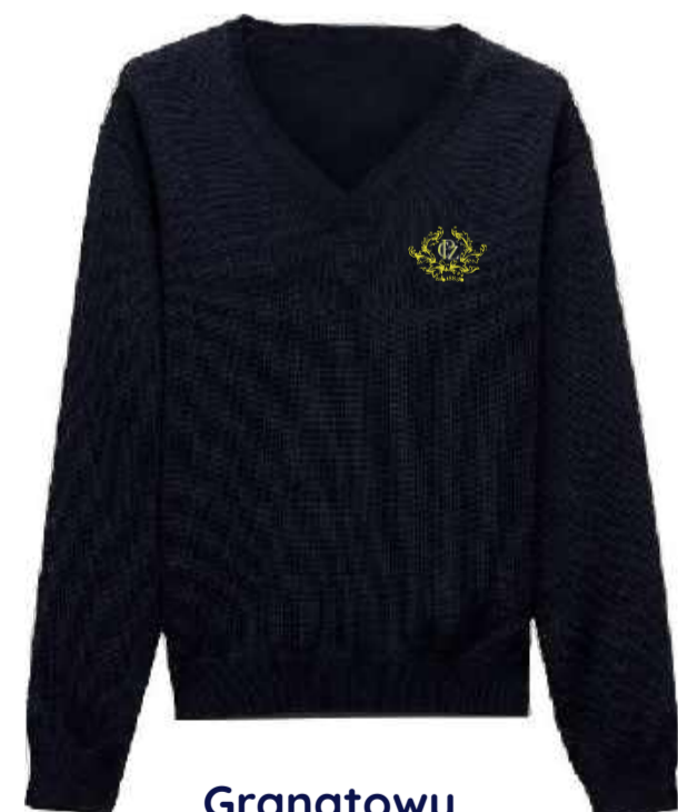
Granatowy sweter (przez głowę)