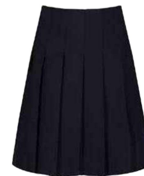
Granatowe spódnica plisowana