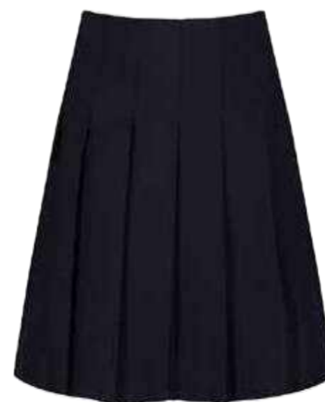
Granatowe spódnica plisowana