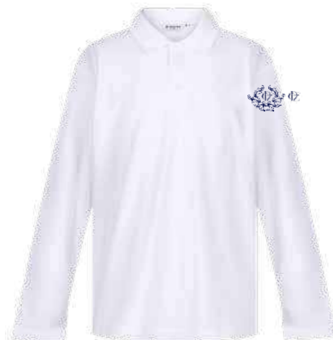
Biała koszulka polo długi rękaw