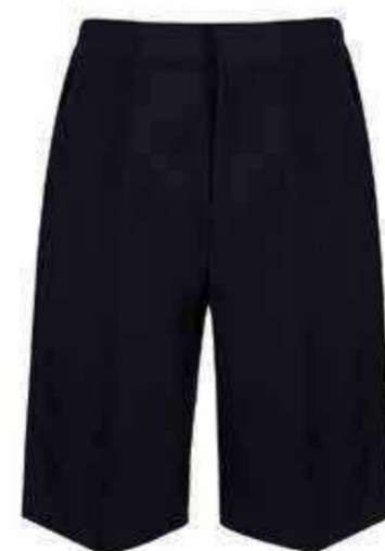
Granatowe krótkie spodnie męskie