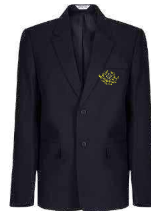
Granatowa marynarka meska