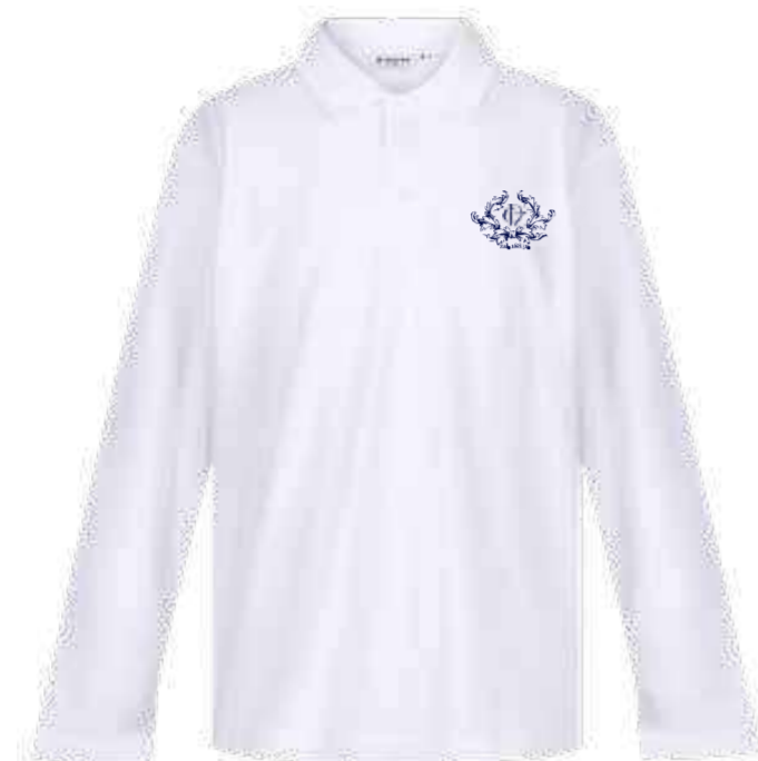
Biała koszulka polo długi rękaw