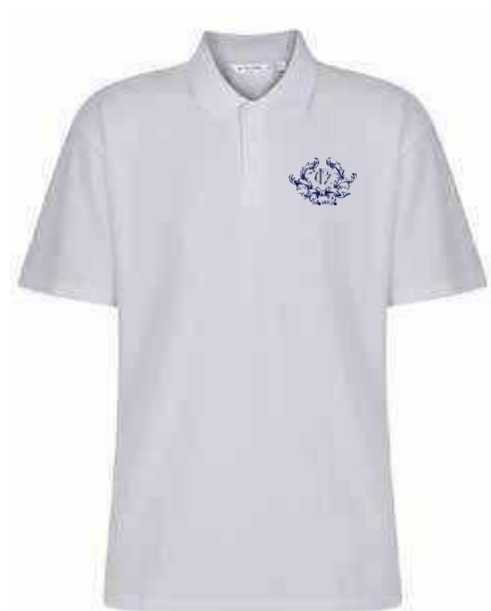
Biała koszulka polo