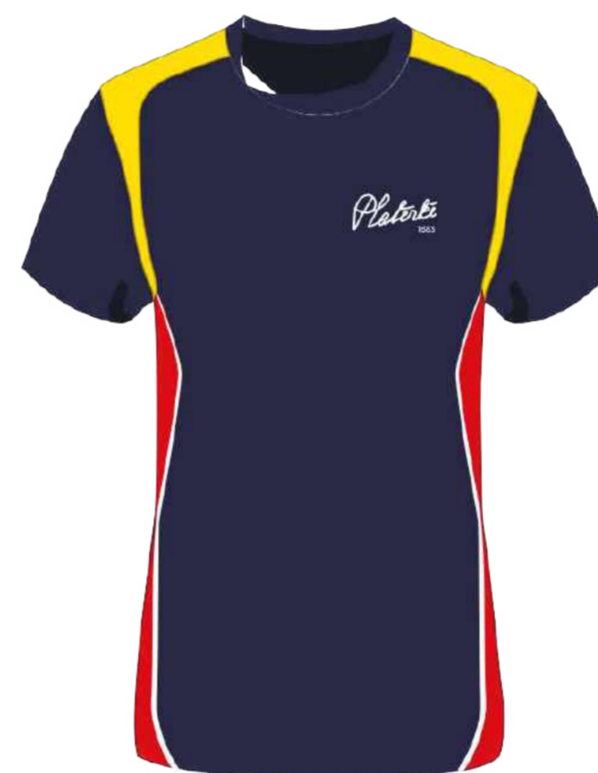
Koszulka sportowa vortex