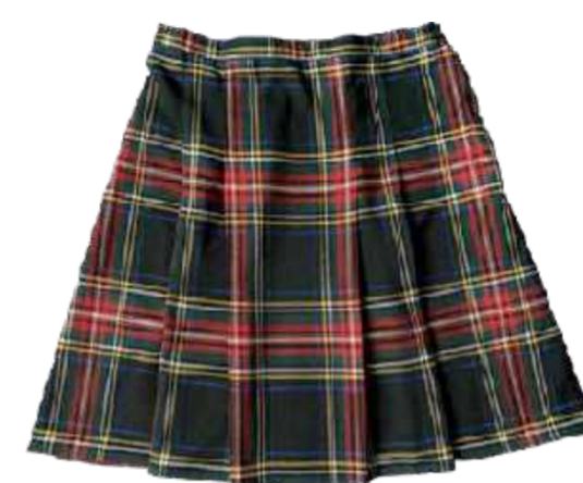
Spódnica szkocki tartan