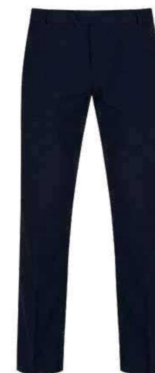
Granatowe spodnie męskie garniturowe