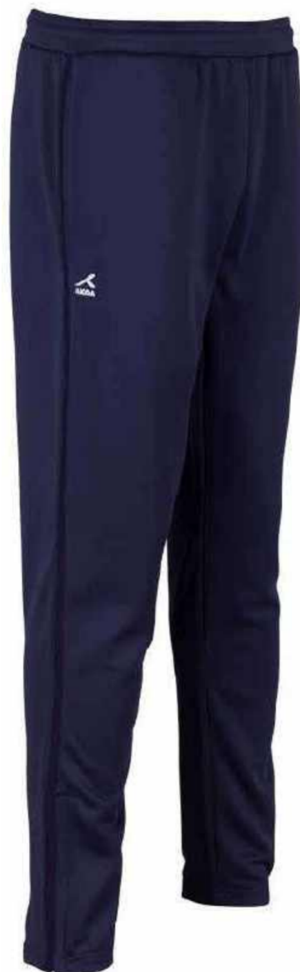
Granatowe spodnie dresowe