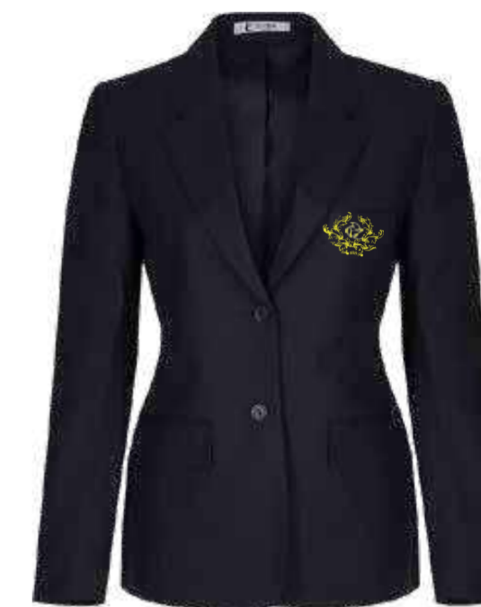
Granatowa marynarka damska