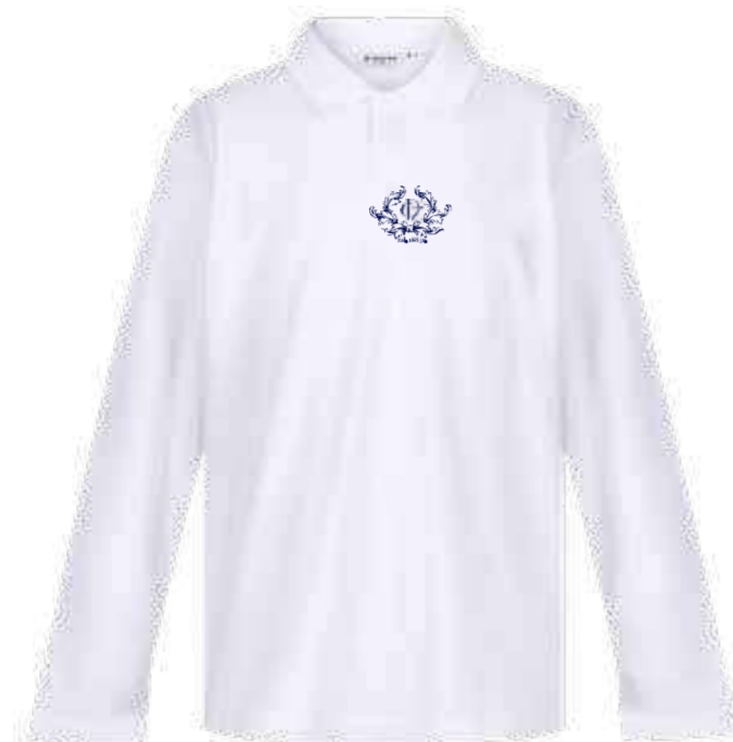
Biała koszulka polo długi rękaw