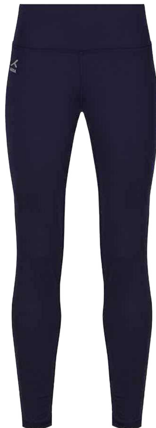
Granatowe legginsy sportowe