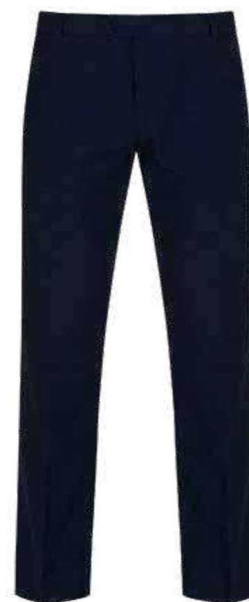
Granatowe spodnie damskie garniturowe lub bawełniane typu chinos