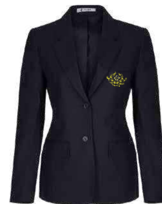
Granatowa marynarka damska