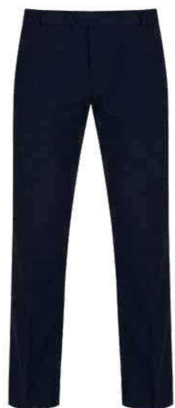
Granatowe spodnie męskie garniturowe lub bawełniane typu chinos