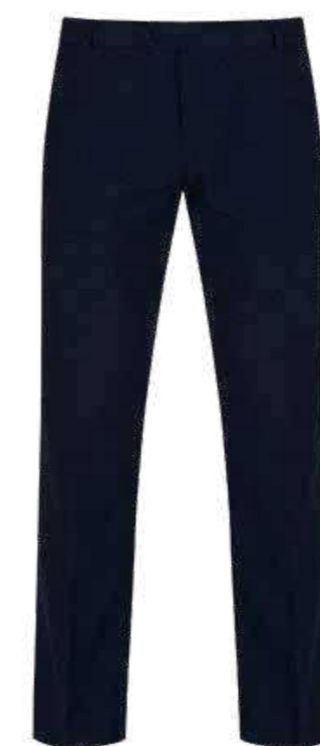
Granatowe spodnie damskie garniturowe lub bawełniane typu chinos